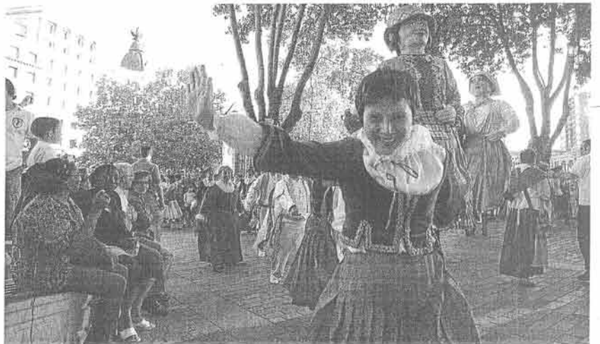
El espectáculo 'Txangoan' puso color y ritmo a las calles de Bilbao ayer por la tarde.

Estrenos y últimas producciones es lo que propone una cita en la que se reúnen dos decenas de compañías procedentes de Francia, Bélgica e Inglaterra, Andalucía, Cataluña, Galicia y Madrid y las vascas En la Iona, Ganso & Cia, Markeliñe y Gaztedi Dantza Taldea. De lo más espectacular del programa es el pasacalles Bivouac , de los franceses Générík Vapeur; unos tipos que animarán la Gran Vía entre Moyua y el Arriaga con mucho, mucho ruido y un montaje espectacular: Bidones,