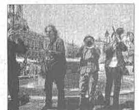
Million Dollar Mercedes Band.

La Gran Vía y varias plazas del Casco Viejo acogerán esta semana un completo abanico de propuestas escénicas que van de la música itinerante, a la danza vertical, junto con el más puro teatro de calle o la fusión con disciplinas circenses, como el clown, juegos malabares y las acrobacias aéreas. Lugar: Bilbao. Gran Vía y Casco Viejo. A partir de las 17.30 horas.