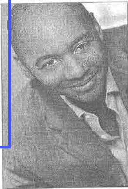
Branford Marsalis Duo & Quartet clausura el Getxo Jazz.

Deporte. Llegada de la primera Regata de Transbordadores de Europa, una veintena de barcos participantes, que partirán el pasado sábado de la localidad francesa de Rochefort. A LAS 12.00, EN EL PUENTE VIZCAYA. GETXO.